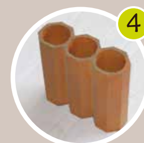
Moulage du produit souhaité