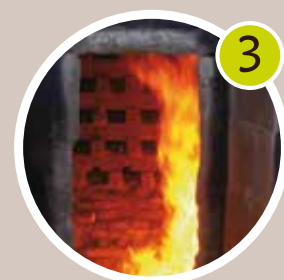
Cuisson au four à bois